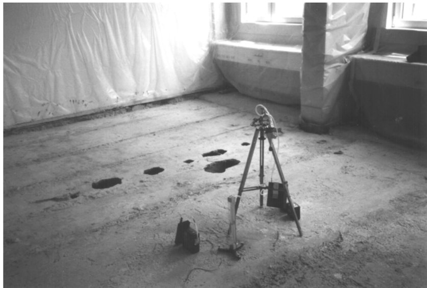
Foto 2: Raum A 720, Parallelmessung am 20.06.2003, links die Wand zur Nasszelle mit der angeschnittenen Teerpappe

Die Sanierungsarbeiten wurden schließlich zwischen Mitte Juni und Mitte Juli 2003 ausgeführt. Erst nach mehreren Besichtigungen der Baustelle - auch durch ein anderes Messinstitut - wurde die Teerpappe und die sichtbaren Reste des Teeranstrichs entfernt. Nach der Reinigung mit einem K 1 - Sauger, aber noch sichtbar offenen Schnittkanten der Teerpappe unter der Leichtbauwand zur Nasszelle und Löchern im Boden, wurde im Raum A 720 eine Kontrollmessung bei deutlich wahrnehmbarem Naphthalingeruch durchgeführt (20.6.03). Das Ergebnis war mit 49 \mu\text{g}/\text{m}^3 Naphthalin entsprechend (siehe Tab. 1, Messung 2).