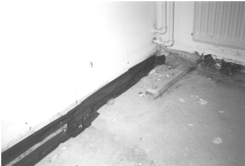
Foto 3: Raum A 720, 25.06.2003, links die Wand zur Nasszelle mit abgeklebter Teerpappe - Schnittkante, rechts Teeranstrichreste

Im Raum A 720 wurden daraufhin die unteren Bereiche der Wände mit Alufolie bedeckt, die mit 'Paket'-Klebeband lückenhaft an den Wänden und dem Betonboden befestigt wurde. Die Messung (25.6.03) ergab immerhin nur noch 14 \mu\text{g}/\text{m}^3 Naphthalin bei deutlich weniger intensivem Geruch (siehe Tab. 1, Messung 3).